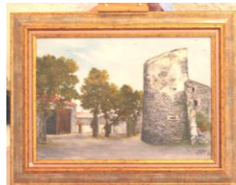
Tableau réalisé par Michelle Culpo